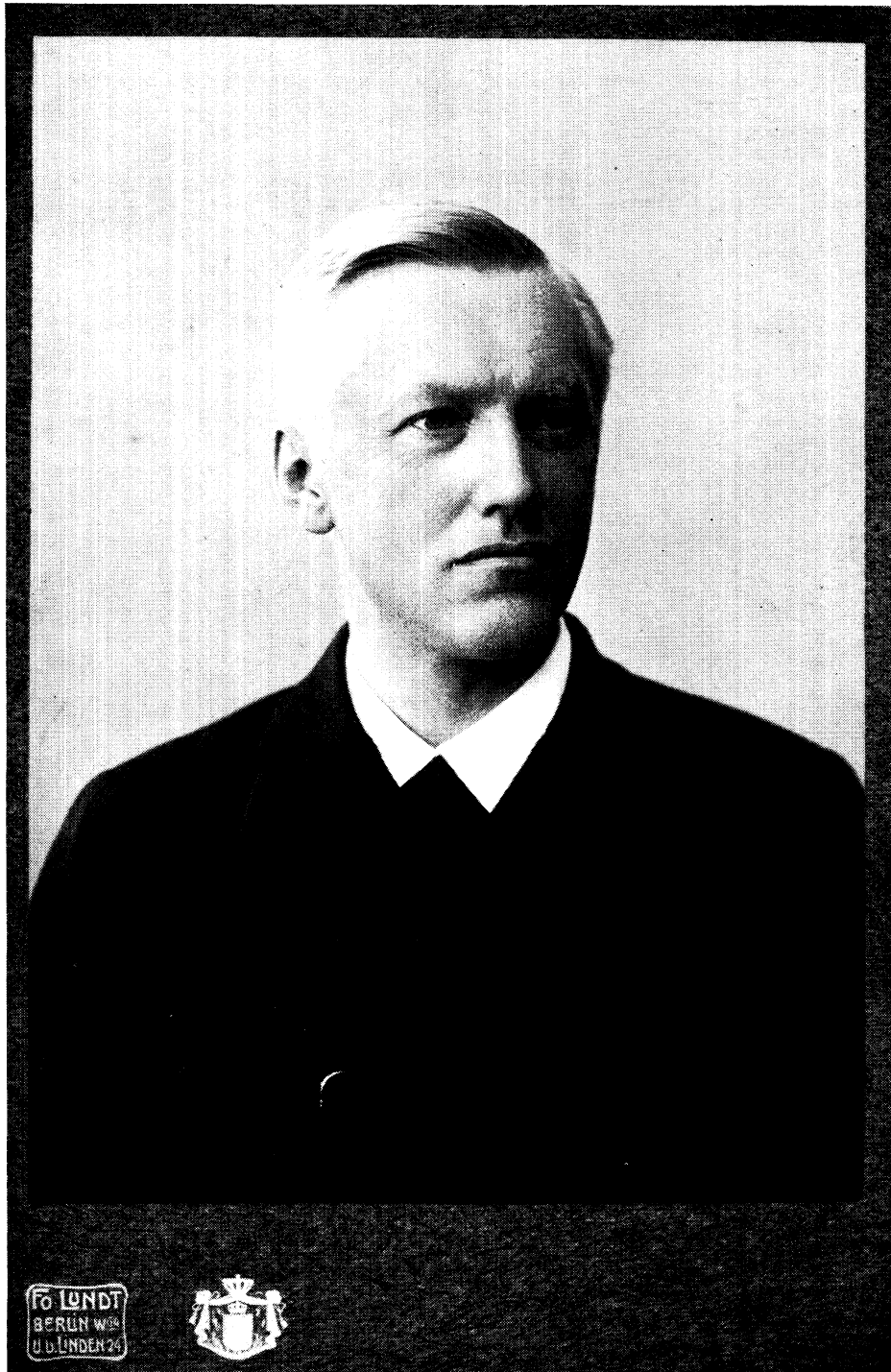
ULRICH VON WILAMOWITZ-MOELLENDORFF ca. 1900