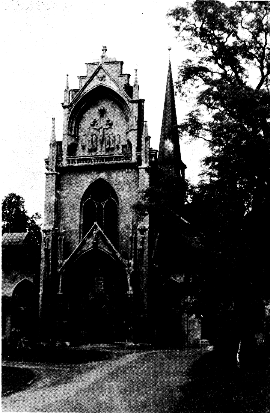
SCHULPFORTE, KLOSTERKIRCHE (1965)